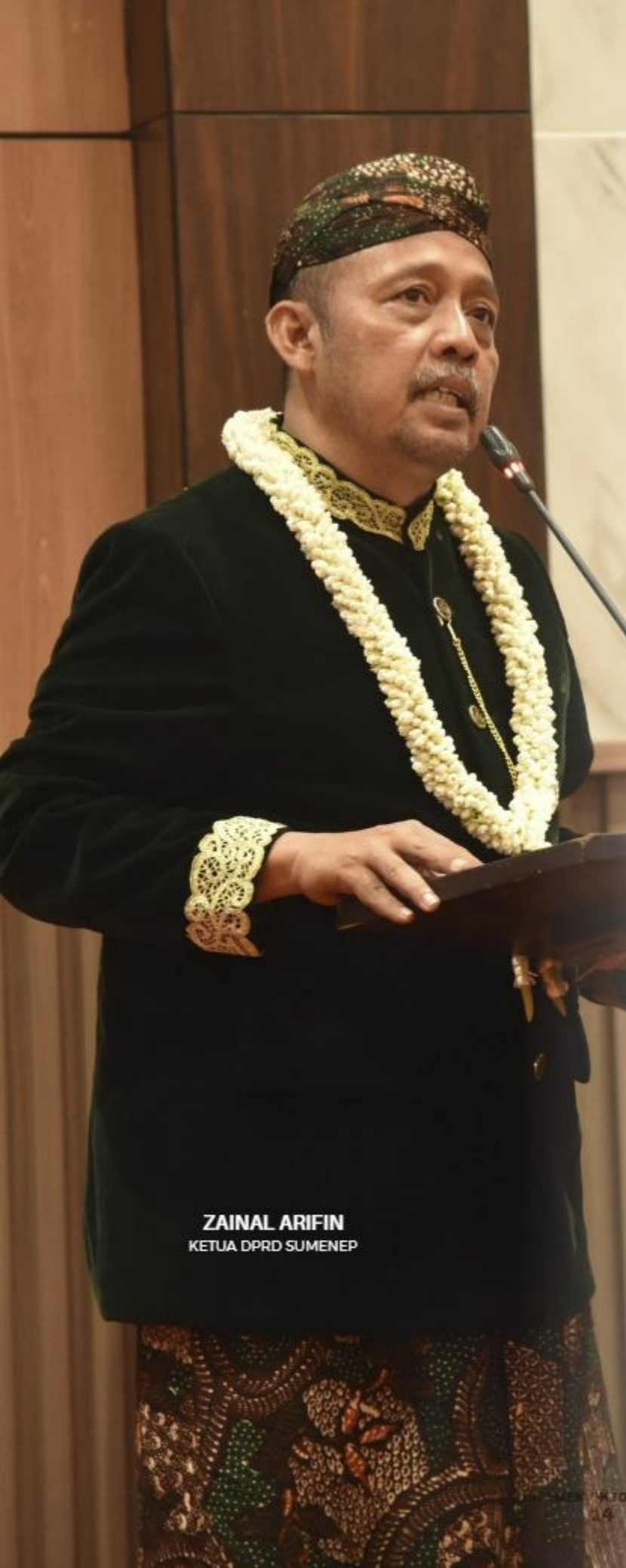
ZAINAL ARIFIN KETUA DPRD SUMENEP