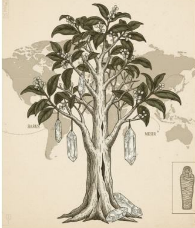
KAPUR BARUS: KRISTAL ABADI DARI NUSANATRA