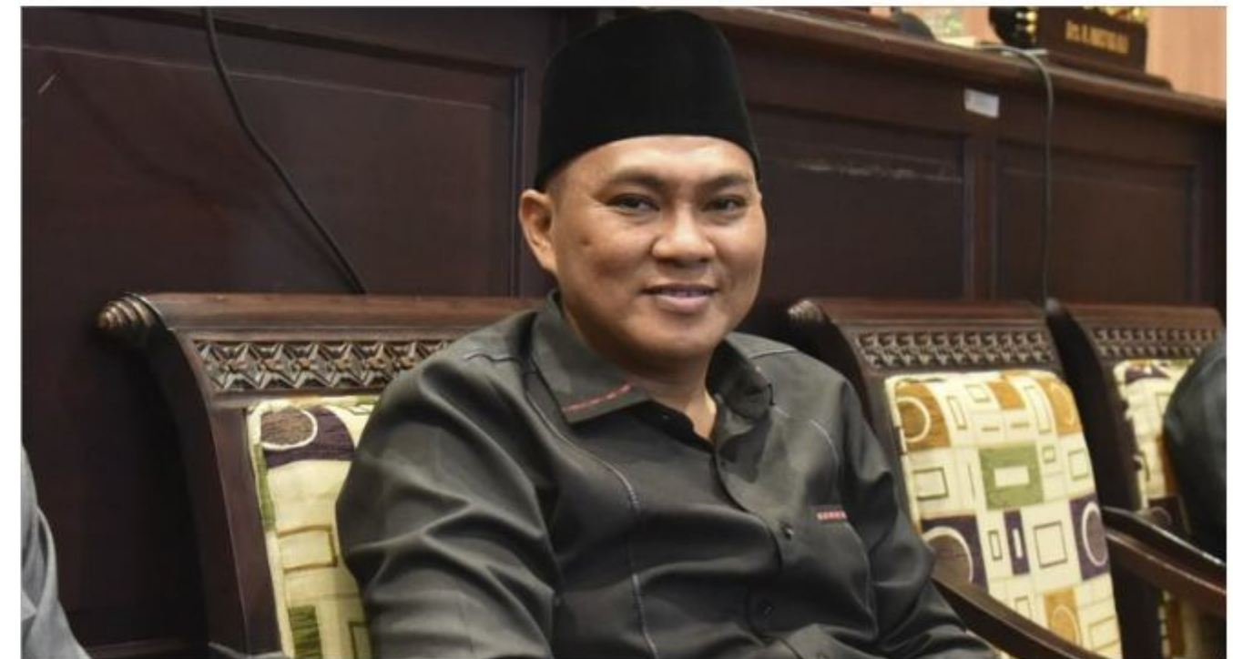
M MUHRI KETUA KOMISI III

"Persoalan itu wajib hukumnya segera diselesaikan. Segera